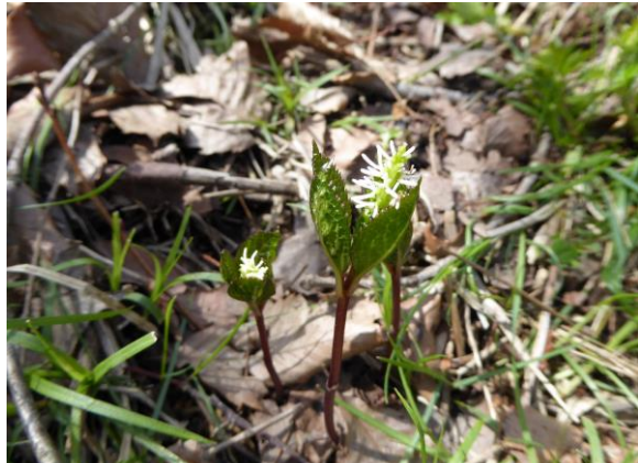
一人静(ヒトリシズカ) 静御前が一人で舞っている姿に見立てた