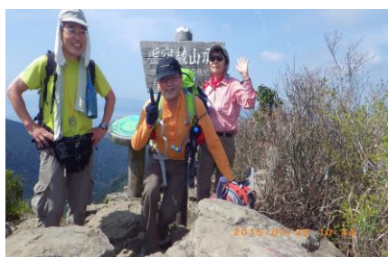
↑ 虚空蔵山山頂にて