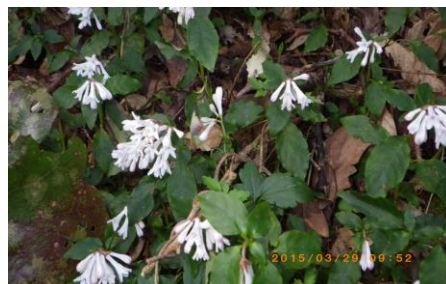
↑ 何という草花か??(虚空蔵山にて)